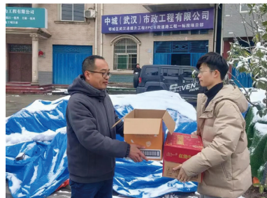
建设公司鄂城区武汉港提升工程项目发放保暖物资