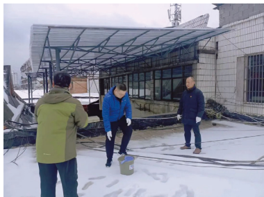
综合管理中心开展基地顶棚安全全检查项目发放保暖物资