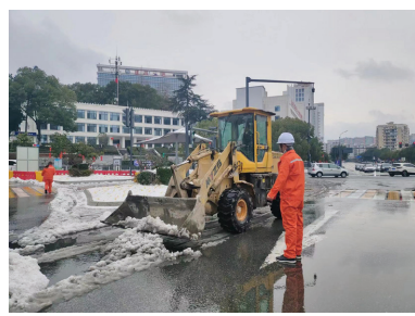
一公司出动应急力量清理城区主干道积雪