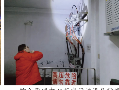
综合管理中心落实设施设备防寒保暖工作