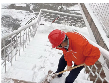
机电公司机船公司清除厂区积雪