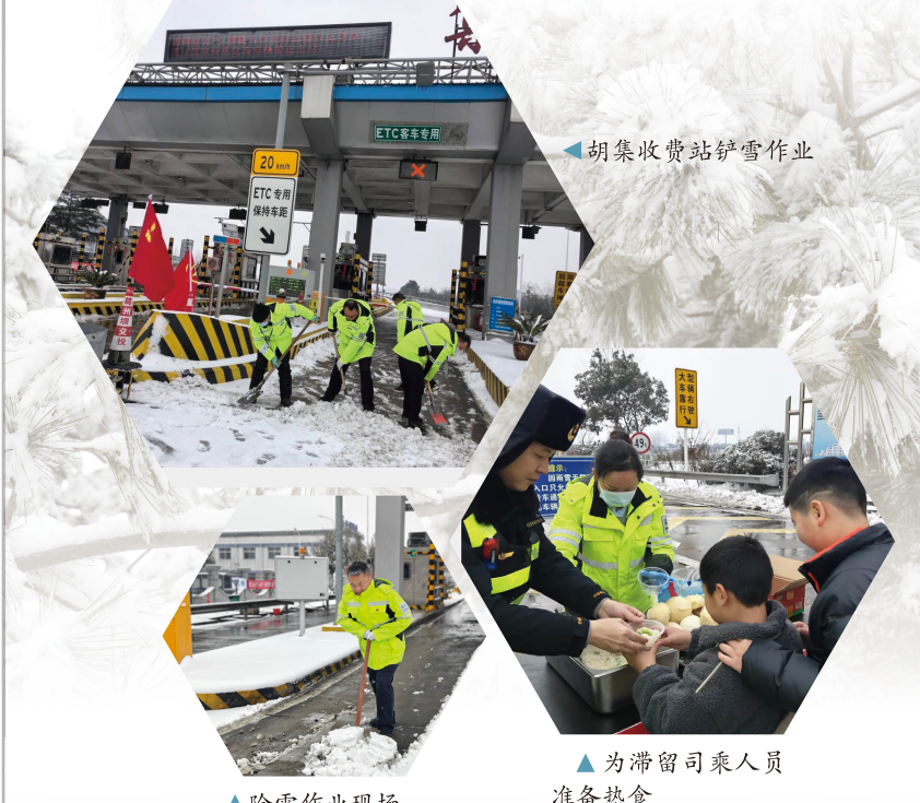
胡集收费站铲雪作业

大雪之下，宜昌基地资产运营中心党员、片区劳务人员、部分商户代表，在基地范围内集中开展经营性资产顶棚安全检查和除雪除冰行动，切实履行经营性资产的安全维护职责。