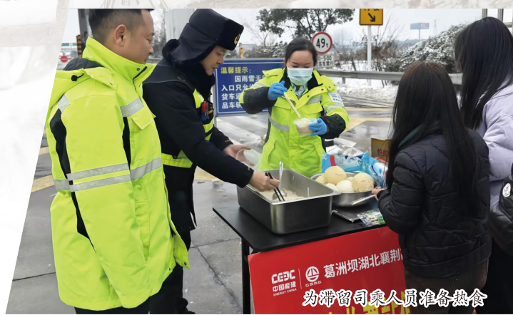
为滞留司乘人员准备热食