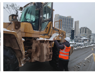
路桥公司助力合益路等重点道路清雪