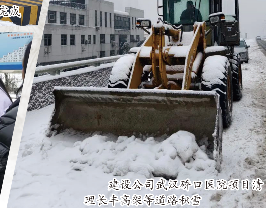
建设公司武汉硚口医院项目清理长丰高架等道路积雪