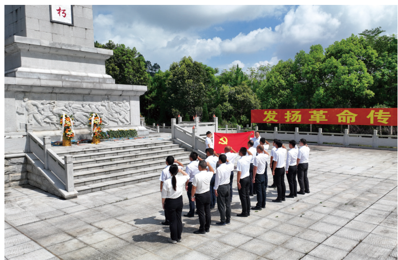
横欽高速党支部开展红色教育