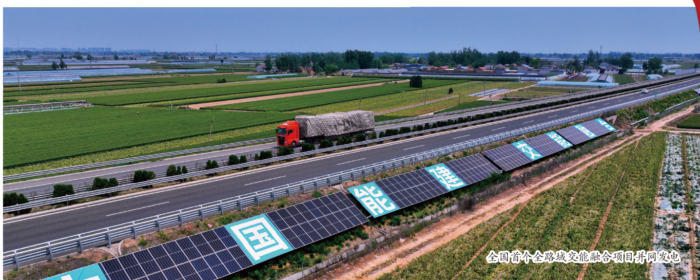
全国首个全路域交能融合项目并网发电

2023年，交投公司通行费收入41.15亿元，同比增长38.4%；资本运作坚持“能投善退”，打好资产盘活“主动仗”。