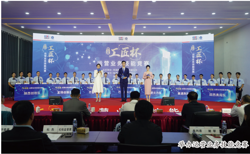
举办运营业务技能竞赛

本报讯（通讯员 余茜）学习贯彻习近平新时代中国特色社会主义思想主题教育开展以来，中国能建葛洲坝交投公司党委聚焦“两强两创”实践目标，全面推进触及灵魂学思想、永葆忠诚强党性、牢记使命重实践、真抓实干建新功，努力将主题教育成果转化为全面提升交通基础设施投融资一体化管理的强大动力。