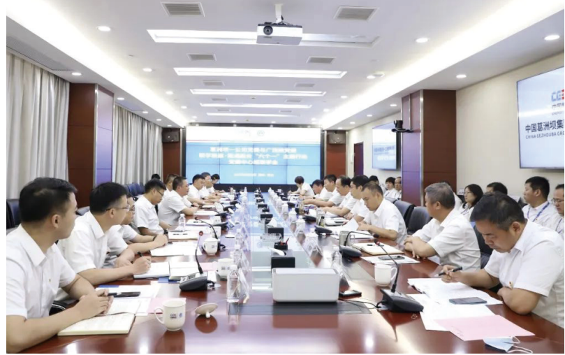
主题教育专题调研