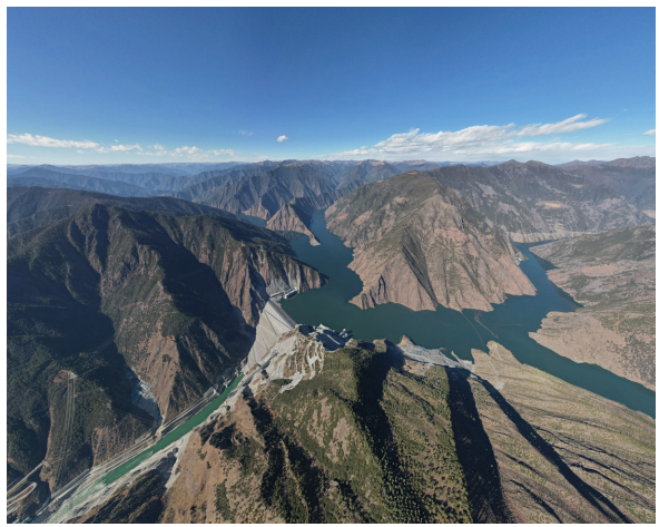
雅砻江两河口水电站高速泄洪系统双曲扭面非对称扩散斜切式挑流鼻坎施工技术