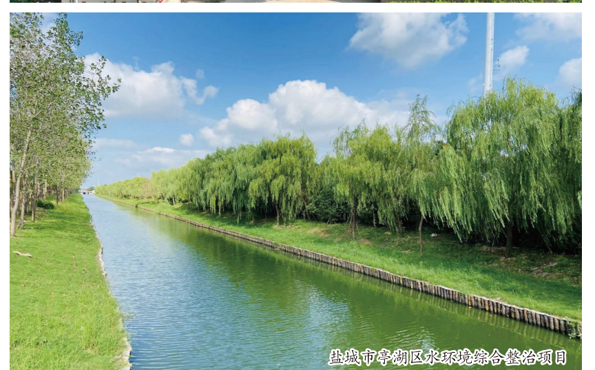
盐城市亭湖区水环境综合整治项目

场地固化稳定化修复技术规范》4项中国能建企业技术标准,在绿色、低碳运营、固废处置、土壤修复等大力拓展的业务领域持续发力,不断强化技术标准建设工作。