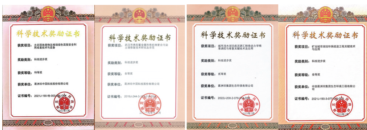
省级科学技术奖励证书