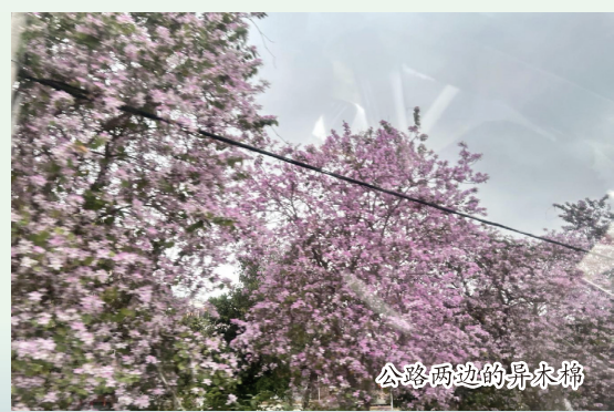
公路两边的异木棉

从实景图上看，广东海岸线曲折漫长，众多岛屿星罗棋布地洒落在海岸线上，可谓山海相嵌，海天交融。茂名浪漫海滩的沙滩洁白细腻，如丝般顺滑，沙滩上竖立着一间间巴厘岛风格的草屋各具特色，充满着浪漫热烈的气息。阳江海陵岛海滩广阔，一派海阔天空，素有“南方北戴河”的美称。依山傍水，陆海交汇，在广东这块开放、富饶的土地上，你能感受到肆意的自然之美，就像岭南漫山竟放的禾雀花，在这片红土地上，在清幽的曲径之间，向着自由与阳光热烈绽放。