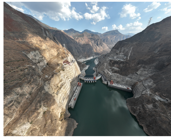
乌东德水电站双向大曲率抗强风高层液压自升式悬臂模板关键技术与应用

二公司申报的“高速泄洪系统双曲扭面非对称扩散斜切式挑流鼻坎施工技术”依托我国海拔最高的百万千瓦级水电站——雅砻江两河口水电站项目实施。项目部技术团队坚持自主研发，勇于开拓创新，先后攻克了高寒高海拔、泄洪流速高、结构极其复杂、骨料含油性悬浮碳颗粒等世界级技术难题。该技术成果填补了多项行业空白，具有实施成本低、施工速度快、体形控制精度高等优点，为今后同类型工程施工提供了借鉴和参考。已获实用新型专利授权6项，申报发明专利1项。